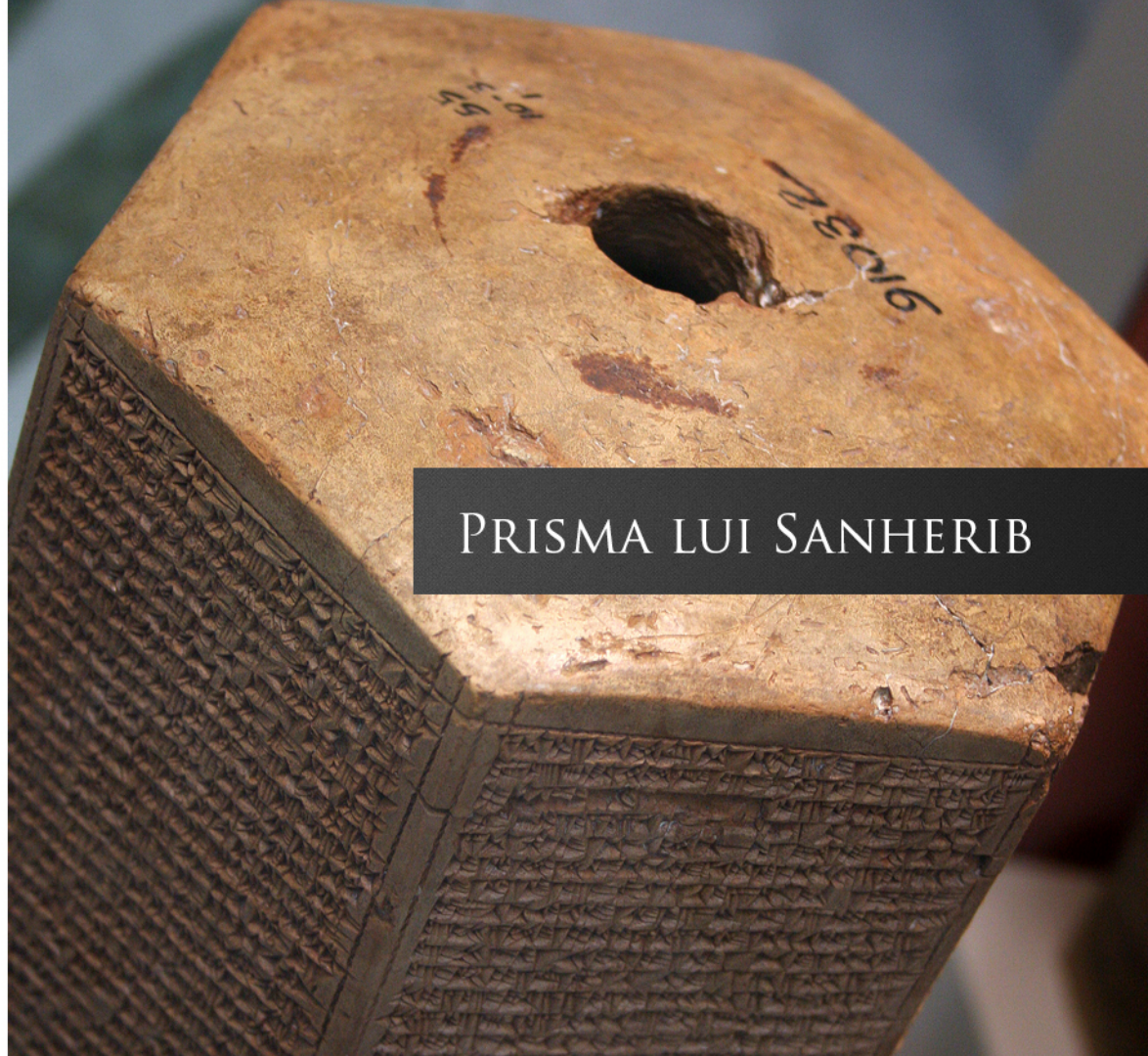
PRISMA LUI SANHERIB